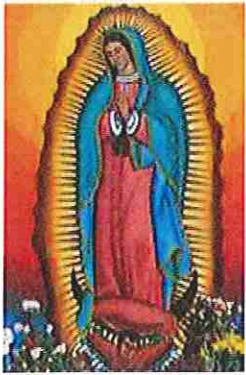
Imagen Misionera de Nuestra Señora de Guadalupe

Ilegara a San Juan Bautista el Sábado 16 de Enero Rezaremos el Santo Rosario a las 5:30 pm